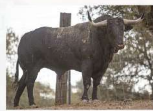
Fadista, N°2 · G-9 Couto de Fornilhos Patrocina: Guarismo 2