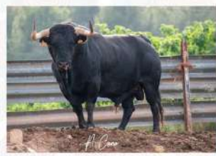
Sumiso, N°28 · G-7 Toros de Mollalta Solta: Raval de Sant Josep Embolada: El Pla Patrocina: A.C.T. La Montera