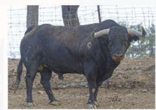
Quinito, N°14 · G-8 Santa Teresa Patrocina: Guarismo 2