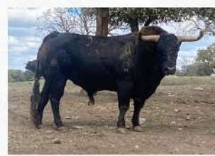
Bilaneto, N°56 · G-8 El Pilar Solta: Raval de Sant Josep Embolada: Raval de Sant Josep Patrocina: Aficionados al Bou de Fira d'Onda