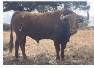
Cubillo, N°50 · G-8 Pedraza de Yeltes Solta: Raval de Sant Josep Embolada: Raval de Sant Josep Patrocina: Peña Recorte