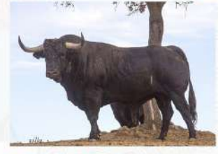
Gandul, N°19 · G-9 Couto de Fornilhos Patrocina: Guarismo 2