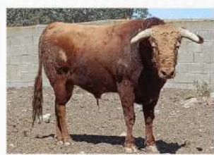
Portico, N°28 · G-9 El Pilar Solta: Raval de Sant Josep Embolada: Raval de Sant Josep Patrocina: Peña Ti-K