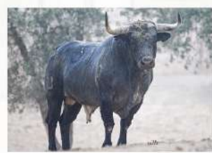
Bandido, N°37 · G-9 Couto de Fornilhos Patrocina: Guarismo 2