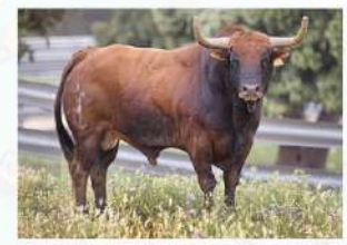
Raterillo, N°10 · G-9 Sergio Centelles Badal Solta: Plaza Rey Don Jaime Embolada: Raval de Sant Josep Patrocina: Stan-K