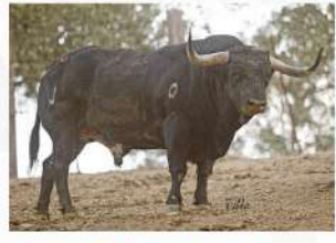
Apoulado, N°14 · G-8 Couto de Fornilhos Patrocina: Guarismo 2