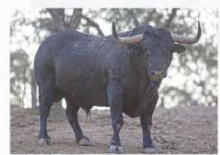
Embrujado, N°17 · G-9 Santa Teresa Patrocina: Guarismo 2