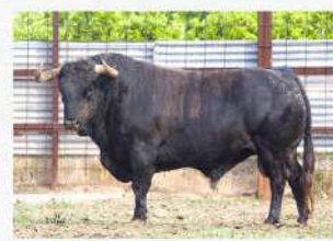
Satelite, N°2 · G-7 Ave María Solta: Raval de Sant Josep Embolada: El Pla Patrocina: A.C.T. 300 Torres