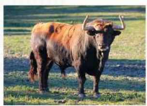
Sereno, N°80 · G-8 Torrealta Solta: Raval de Sant Josep Embolada: Raval de Sant Josep Patrocina: A.C.T. Pañuelito Verde