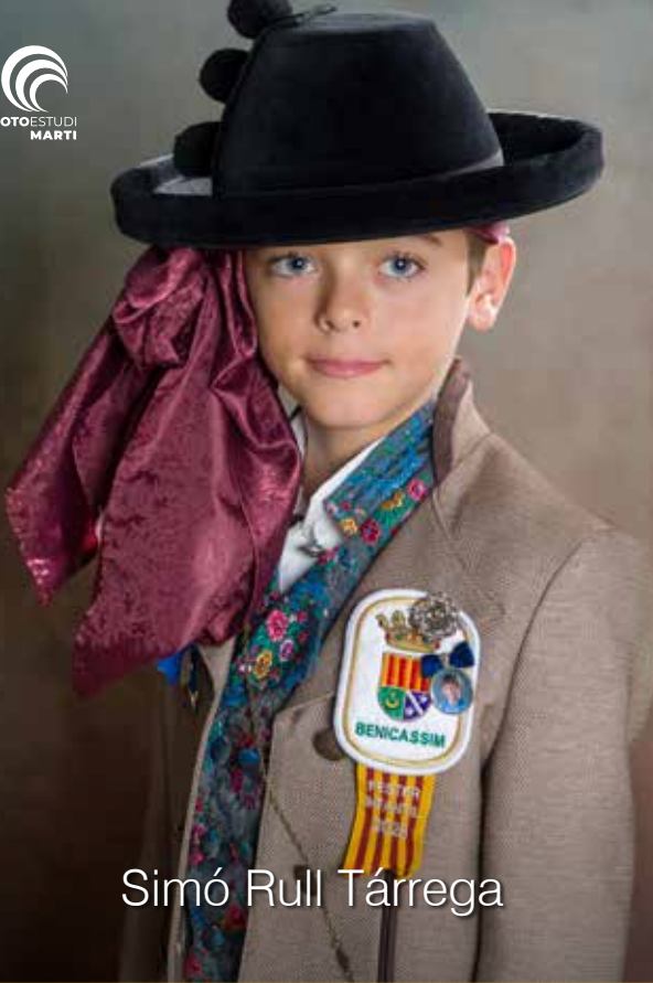
Simó Rull Tárrega